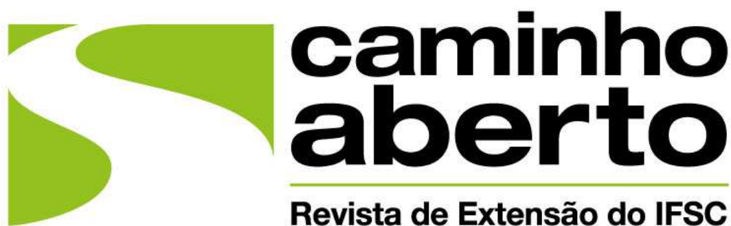
Figura 1: Marca da Revista Caminho Aberto.

As figuras, os quadros e a sua legenda devem ser centralizados na extensão da largura da página (Fig. 1). A identificação das figuras e dos quadros deve ser na parte inferior; das tabelas, na parte superior, alinhada à margem esquerda. A referência da fonte, quando não de autoria própria, deve ser colocada logo abaixo da figura, tabela ou quadro, em letra maiúscula / minúscula, precedida da palavra FONTE. As anotações e as numerações devem ser formatadas em fonte Times New Roman , tamanho 12.