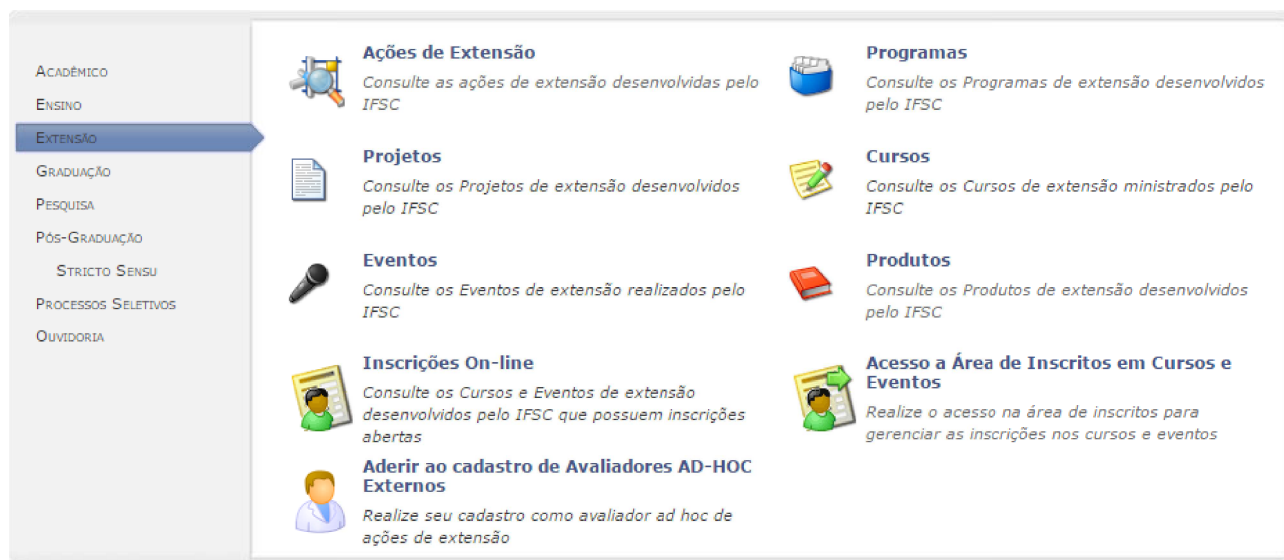
Portal público do SIGAA-Extensão

Após realizar submissão de inscrição, o(a) interessado(a) receberá orientações no e-mail. Será necessário validar a inscrição clicando no link do e-mail e informando a senha de confirmação. A Proex não se responsabiliza por requerimentos de inscrições não recebidos em decorrência de eventuais problemas técnicos.