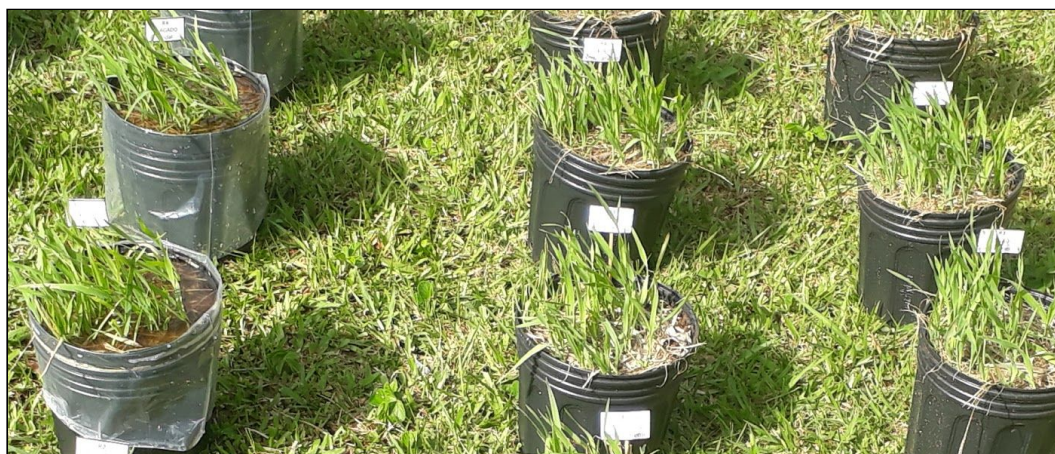
Figura 1 - Vasos com aveia sob alagamento

Nos editais de fluxo contínuo do IFSC, os projetos intitulados Aveia Branca (avena sativa l.) sob alagamento e Degradação de sacolas plásticas sob diferentes condições de descarte sob coordenação do professor Fábio Zanella foram aprovados e desenvolvidos pelo câmpus.