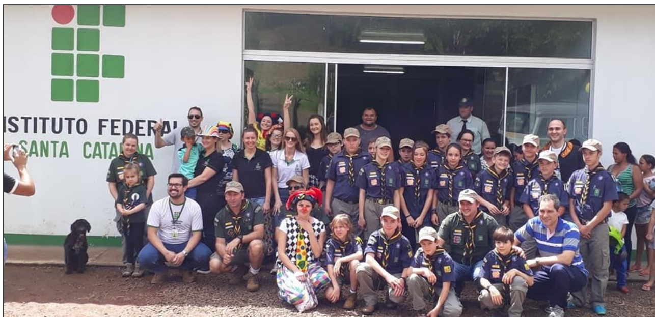
Figura 3 - Projeto “Minha alegria é sua alegria” levando presentes às crianças carentes

* Projeto realizado no Câmpus São Lourenço embora durante o cadastro a coordenadora ainda estava vinculada ao Câmpus São Carlos no sistema SIGAA.