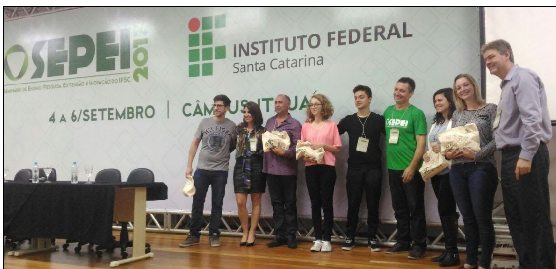
Figura 4 - Premiação no SEPEI 2017