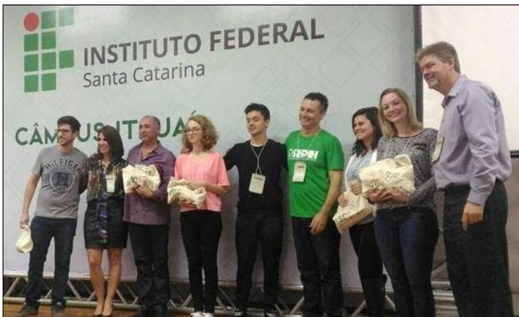
Figura 2 - Premiação no SEPEI