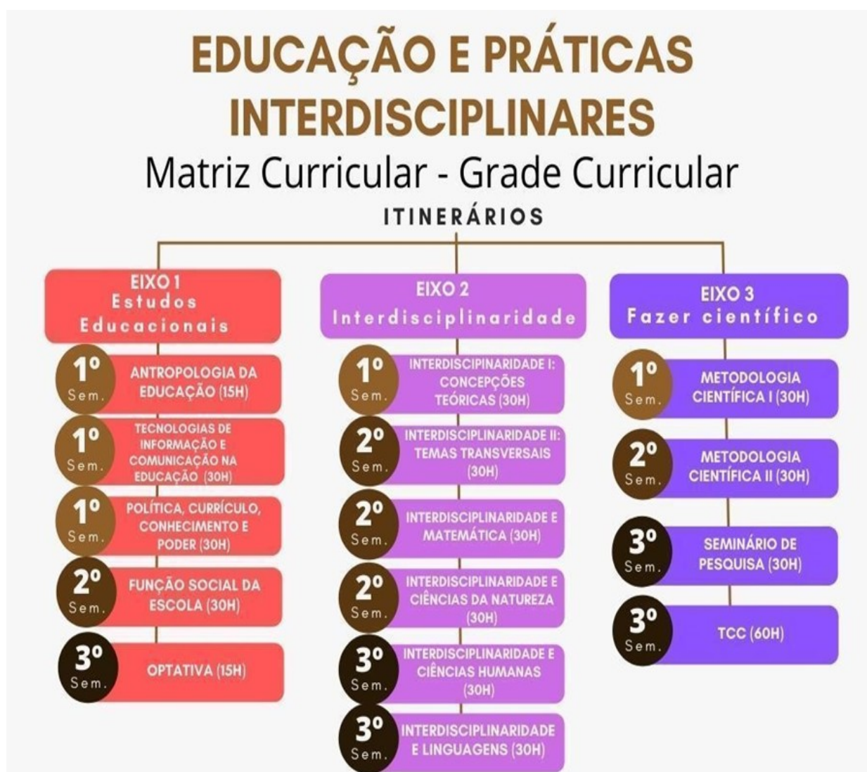
Infográfico I: Componentes Curriculares por semestre e carga horária

A matriz curricular do curso de especialização em Educação e Práticas interdisciplinares foi organizada com vistas a promover reflexões que favoreçam a atuação dos profissionais que seja atenta às necessidades educacionais específicas cidadã e que contribua para construção de saberes e práticas em uma perspectiva interdisciplinar. Trata-se de uma organização que valoriza a integração de saberes, o diálogo entre as diferentes áreas de conhecimento, estimulando uma formação continuada de profissionais da educação que propicie a elaboração de projetos de ensino de natureza interdisciplinar, unindo ensino, pesquisa e extensão.