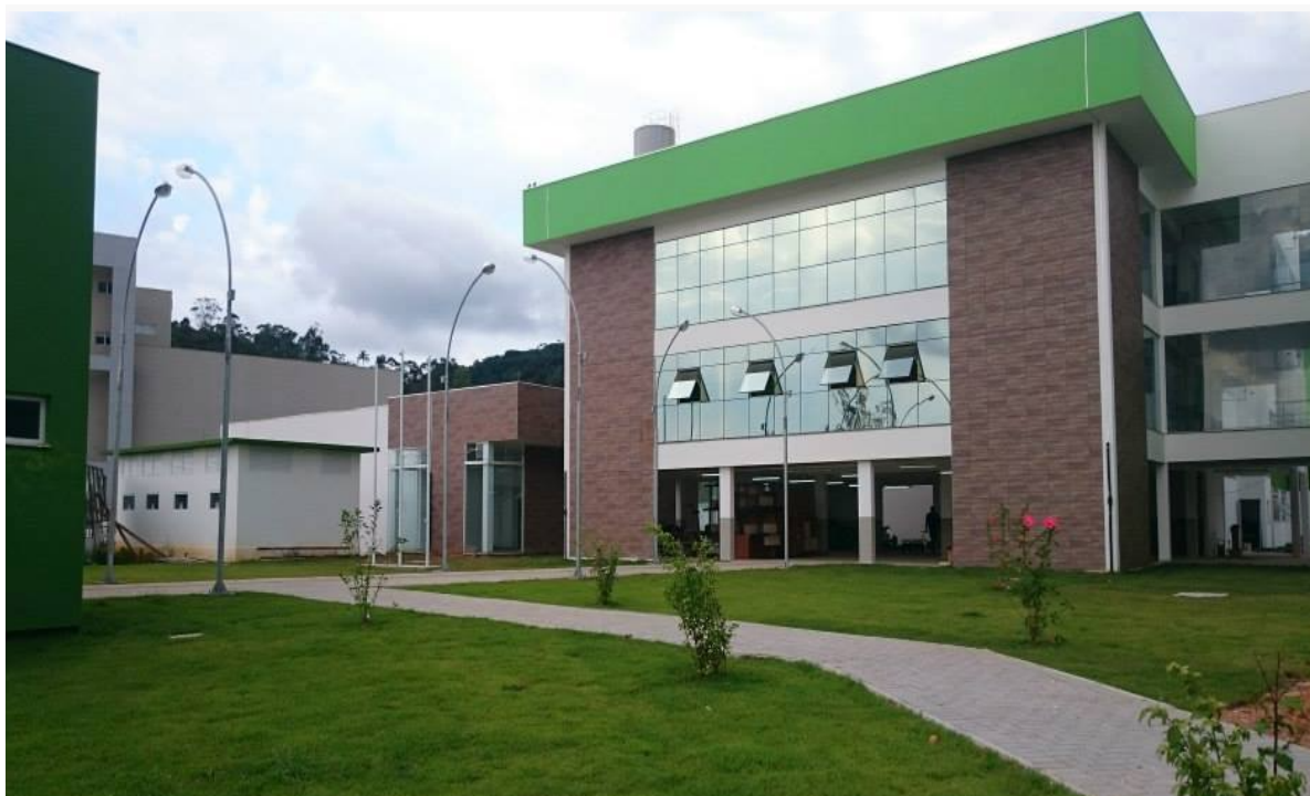
(sede própria inaugurada em junho/2015)

A sede própria, situada na Avenida Vereador Abrahão João Francisco, foi inaugurada em 19 de junho de 2015. A unidade conta com mais de 7 mil metros quadrados de instalações e uma completa infraestrutura formada por salas de aula, laboratórios, biblioteca, ginásio, salas administrativas, cantina e auditório. Atualmente oferta os seguintes cursos regulares: técnicos integrado em Mecânica e Recursos Pesqueiros, técnicos subsequentes em Aquicultura, Eletroeletrônica e Mecânica, curso superior de Engenharia Elétrica, pós-graduação em “Ciências Marinhas Aplicadas ao Ensino” e mestrado em “Clima e Ambiente”.