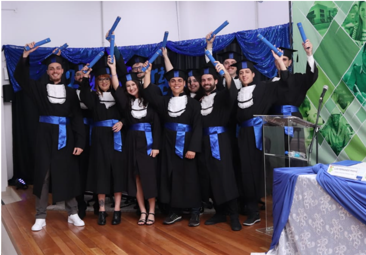
(Figura 1: primeira formatura presencial do Curso Superior em Engenharia Elétrica)

primeiros graduados formados pelo Câmpus desde a sua instalação neste município em 2008. A SNCT teve duas alterações de datas, que foram significativas e de certa forma trouxeram prejuízo ao evento tão bem elaborado pela Comissão, pela baixa participação, devido ao ano letivo muito apertado. A primeira alteração foi em razão do defeso eleitoral, haja vista que o tema trazia em seu bojo relação com as mudanças políticas do nosso país e poderiam causar constrangimentos aos palestrantes em determinados assuntos. E a segunda foi causada pelo bloqueio das rodovias que davam acesso ao Câmpus, impedindo convidados, servidores e alunos de participarem das atividades acadêmicas. O evento ocorreu então entre os dias 03 e 05/12/2022.