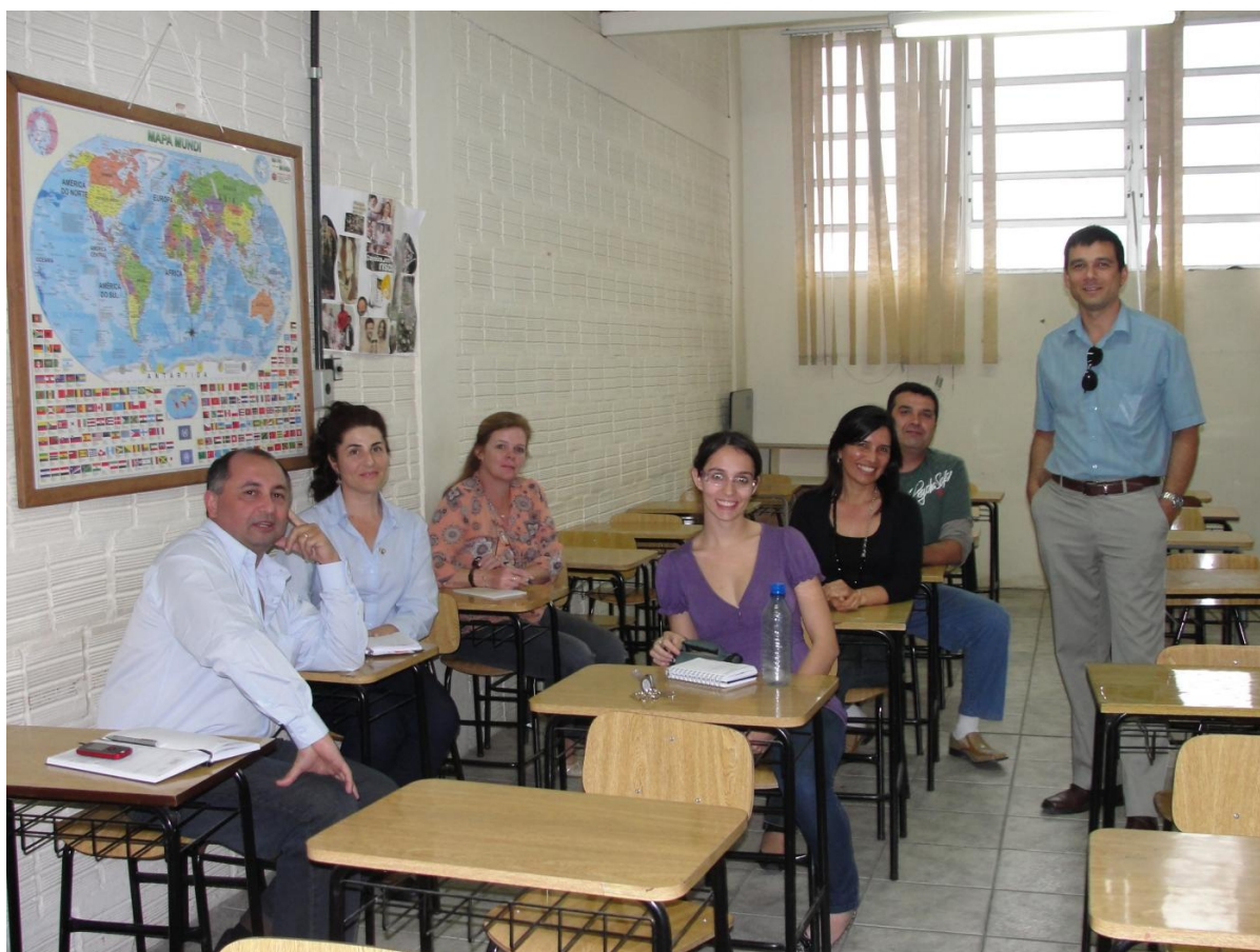
(Primeiros servidores do Câmpus Itajaí em sede provisória da FEAPI na Rua Tijucas, centro)

Ainda em 2006, o IFSC firmou convênio com a prefeitura, através da Fundação de Educação Profissional e Administração Pública de Itajaí (Feapi) para a implantação do curso técnico em Pesca. A Feapi foi responsável pela contratação dos professores e a disponibilização do espaço físico para as aulas e o IFSC por toda a parte de projeto pedagógico, coordenação e supervisão do curso bem como pela emissão dos certificados.