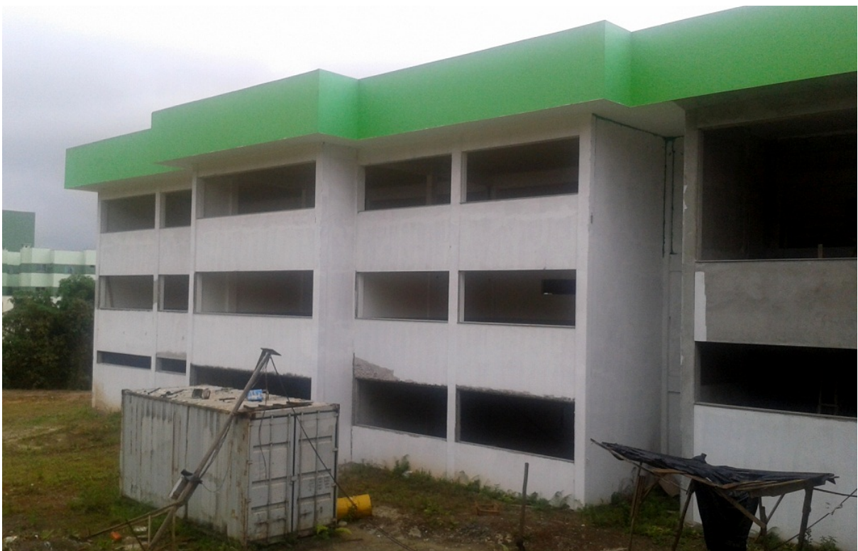
(Obra reiniciada em 2013)