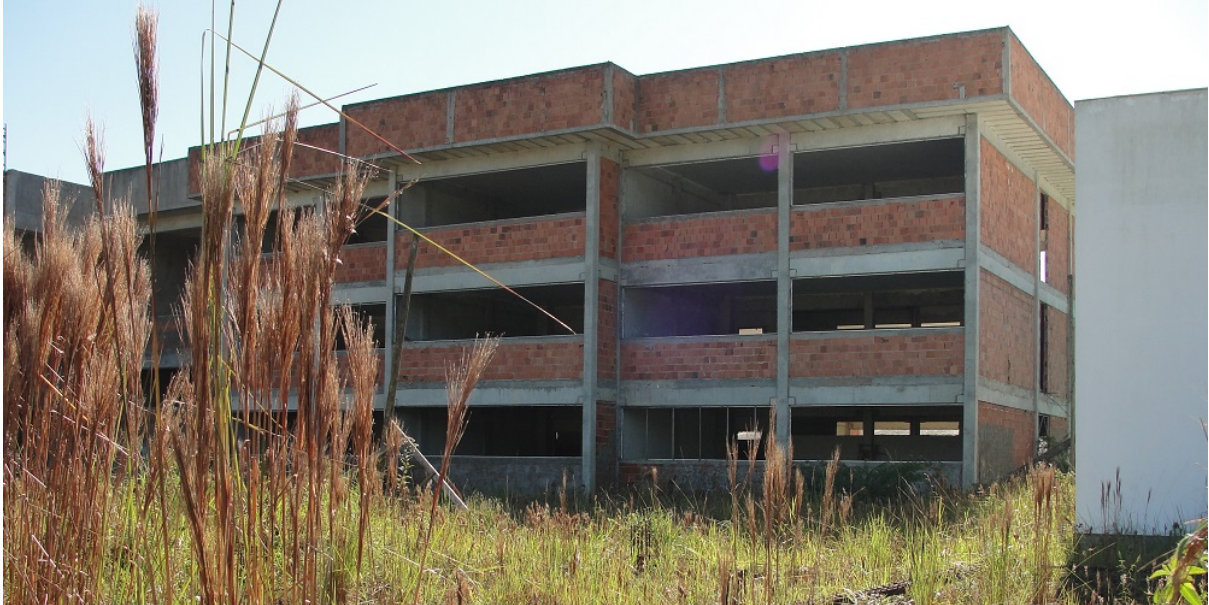
(Obra interrompida em 2010)

funcionou em endereço provisório, situado na Rua Tijucas nº 55 no Centro de Itajaí. Nesta sede, ampliou-se a oferta de cursos com ênfase nos de qualificação profissional, sendo ofertados os seguintes cursos: técnico em Pesca, técnico em Aquicultura e os cursos de Formação Inicial e Continuada (FIC) em Operador de Computador, NR-10, "Fundamentos de Corrosão e Técnicas de Proteção" e "Instalações Elétricas Residenciais".