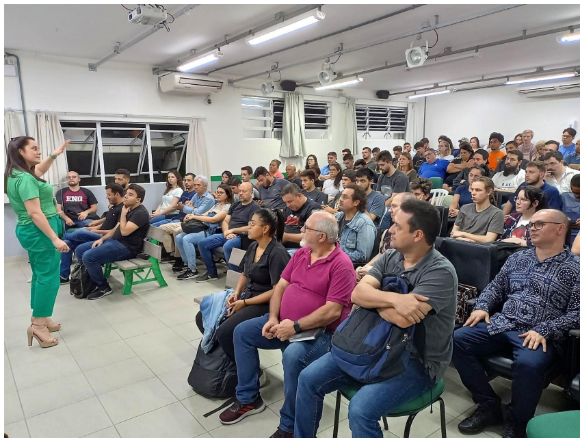
Figura 4 - Palestra sobre membranas eletrofiadas na Semana Nacional da Ciência e Tecnologia de 2022.

A programação trouxe também palestras, mostra com visitação ao Planetário Móvel da Udesc Joinville e apresentações de projetos de ensino, pesquisa e extensão desenvolvidos por servidores e estudantes do câmpus.