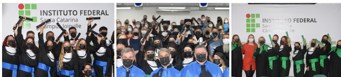
Figura 2 - Comemoração dos recém formados dos Cursos Superiores de Engenharia Elétrica, Gestão Hospitalar e Mecatrônica Industrial, e técnicos em Mecânica, Enfermagem e Eletroeletrônica.

Com a possibilidade do retorno dos eventos em formato presencial, foram realizadas no auditório do câmpus as primeiras cerimônias de formaturas e colação de grau após a Pandemia da COVID-19. Ainda que com o uso obrigatório de máscaras para todos os presentes nas primeiras sessões, foi perceptível a importância da retomada e diferença do evento presencial neste tipo de cerimônia.