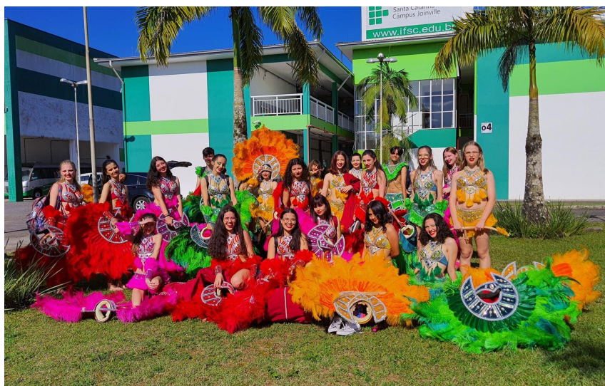
Figura 3 - Grupo de Dança da Escola Municipal Governador Pedro Ivo Campos de Joinville na Semana Nacional da Ciência e Tecnologia de 2022.

A programação trouxe também palestras, mostra com visitação ao Planetário Móvel da Udesc Joinville e apresentações de projetos de ensino, pesquisa e extensão desenvolvidos por servidores e estudantes do câmpus.