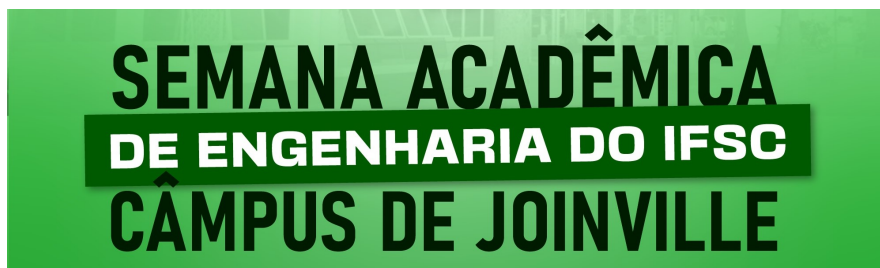
Figura 10 - Folder de divulgação da 3ª Semana Acadêmica das Engenharias do Câmpus Joinville .

Foi realizada a 3ª Semana Acadêmica das Engenharias do Câmpus Joinville