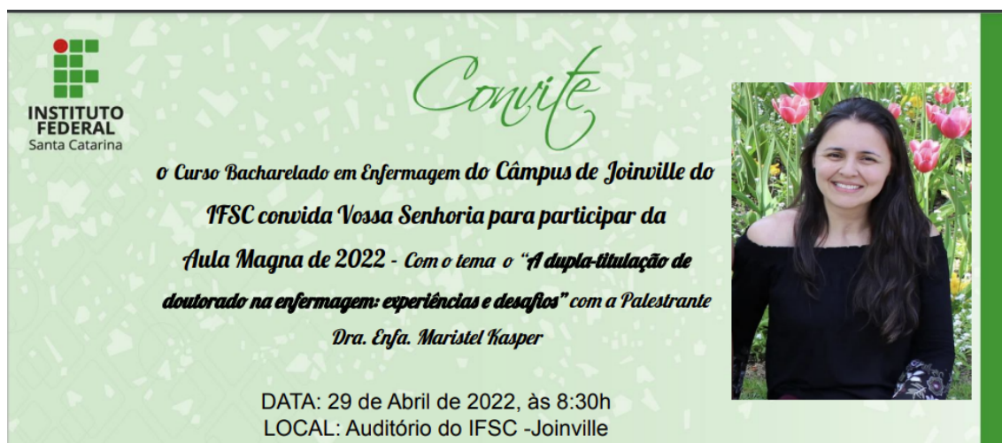
Figura 7 - Convite para Aula Magna 2022 do Curso de Bacharelado em Enfermagem.