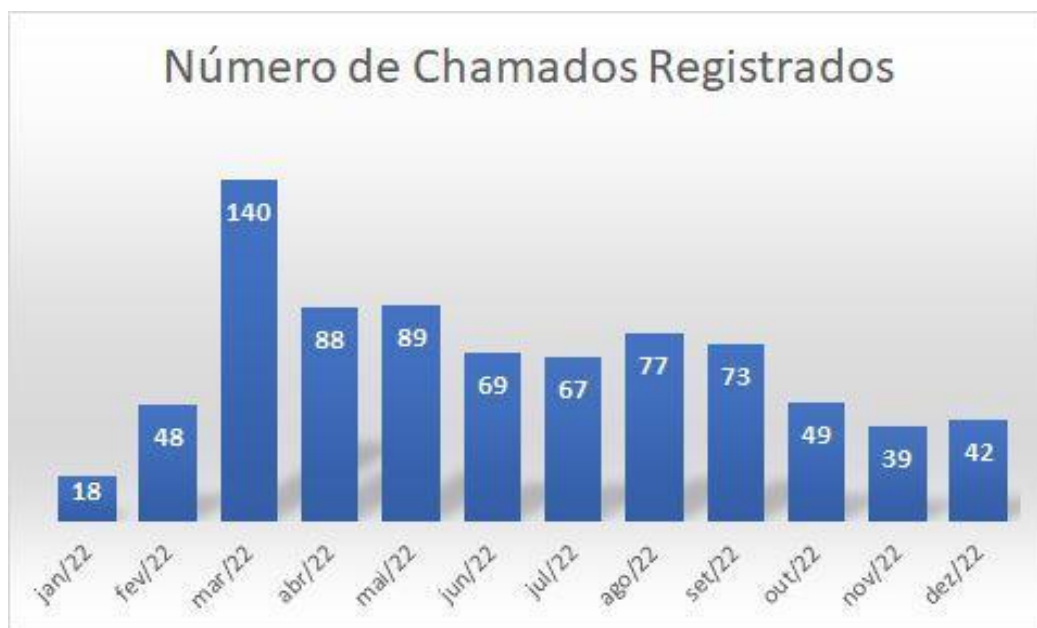
Figura 8 - Gráfico número do registro dos chamados para o Suporte da CTIC do Câmpus Joinville.

atividades administrativas. A flutuação de chamados corresponde a momentos mais críticos no ano, como início de semestre das atividades acadêmicas.