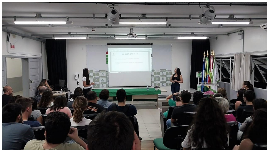
Figura 5 - Apresentação de projetos de pesquisa e extensão na Semana Nacional da Ciência e Tecnologia de 2022.

Os demais eventos, vinculados à áreas/cursos, serão apresentados nos seus respectivos espaços nos capítulos seguintes.