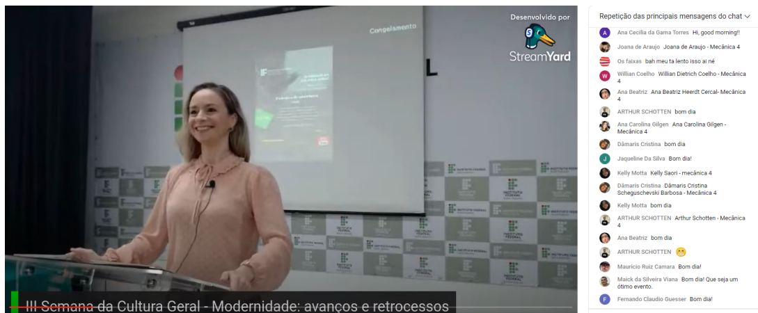
Figura 9 - Abertura da III Semana da Cultura Geral do Câmpus Joinville .

Como nos anos anteriores, todos os estudantes dos cursos técnicos integrados foram convidados para participar do evento. Foram organizadas atividades matutinas e vespertinas nos dois dias do evento, o qual contou com palestras, oficinas e atividades culturais.