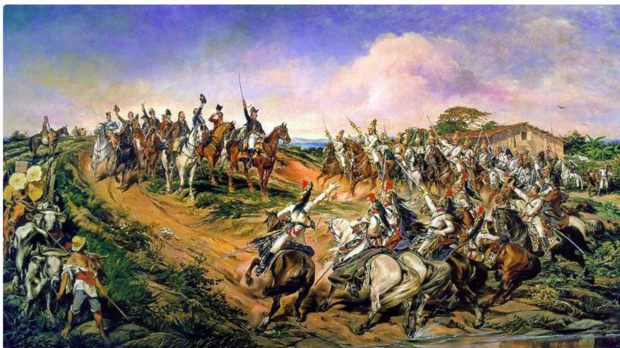
Pintura de Pedro Américo que retrata o Grito do Ipiranga realizado por d. Pedro em 7 de setembro de 1822. [1]