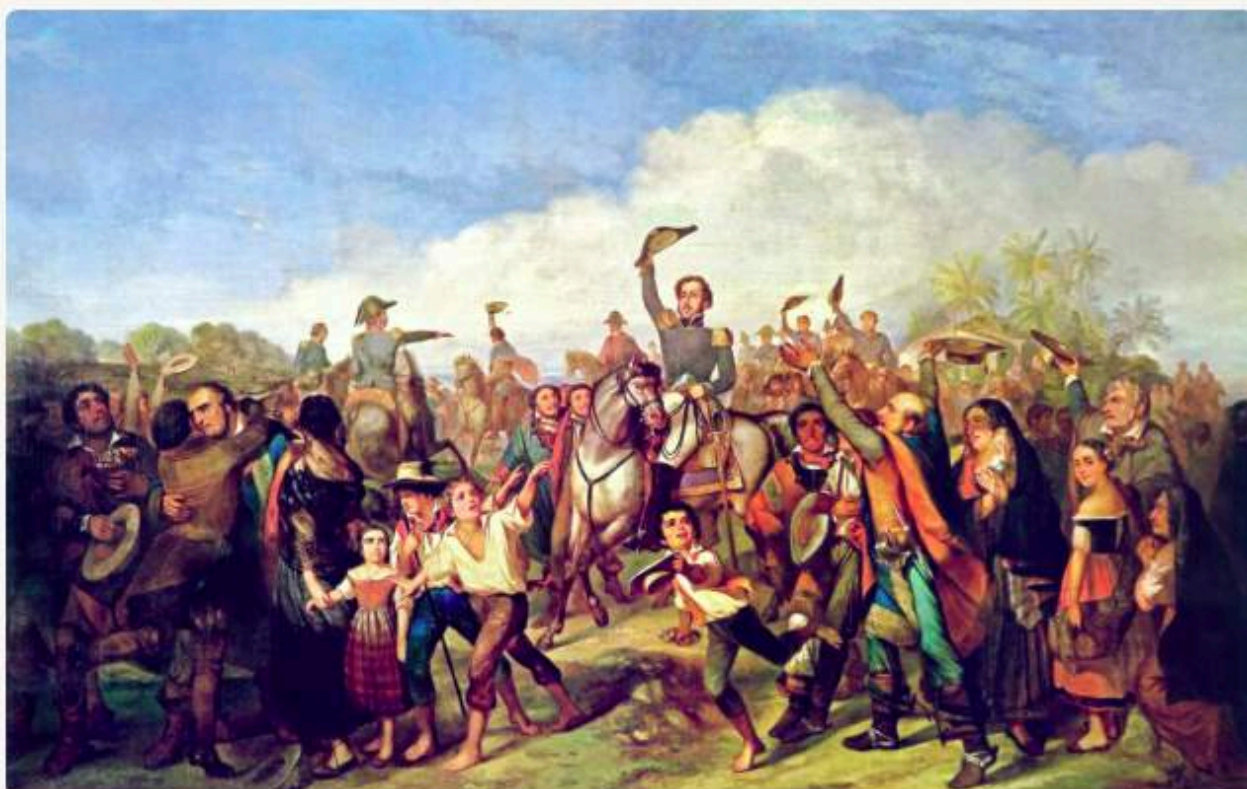
"A proclamação da Independência", de François-René Moreaux, 2,44 m x 3,83 m, 1844. Museu Imperial de Petrópolis, Rio de Janeiro.